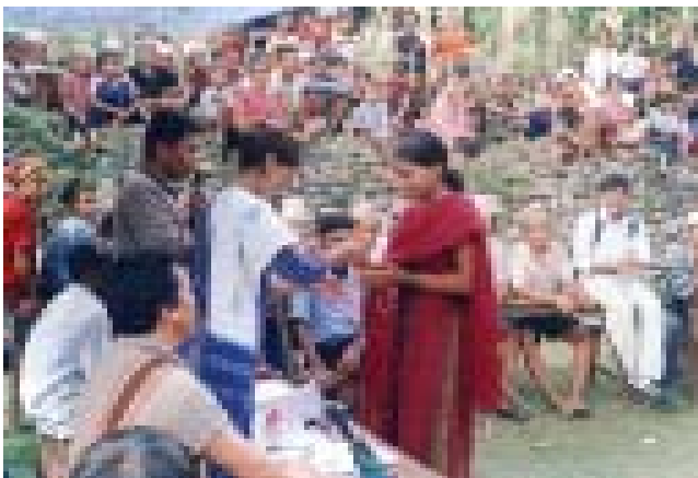
सन् २००७ मा ने.चे.सं.को गोरखा जिल्ला कार्यकारिणी समितिको सहसचिवमा नियुक्त एक युवा चेपाङ महिला

चेपाङहरूको कथामा एउटा पृथक कुरा भनेको बहिष्कृत समूहका बदलिँदो आवश्यकतामा आधारित कार्यक्रम निर्माण तथा साभेदारी प्रक्रियामा रहेको नौलोपन हो । चेपाङहरूले सरकार समक्ष आफ्ना अधिकारका लागि वकालत सुरु गर्दा वा राष्ट्रिय तहमा सहयोगको खोजी गर्दा उनीहरूलाई आफ्नै राष्ट्रिय संस्था आवश्यक थियो । तर त्यसको आधारशीला स्थानीय तहमा खडा गरिनु पर्दथ्यो । त्यसै कारण ने.चे.सं.लाई प्रायः गाउँगाउँमा पहुँच भएका थोरै संस्थाहरूमध्येको एउटा संस्थाका रूपमा लिने गरिन्छ ।