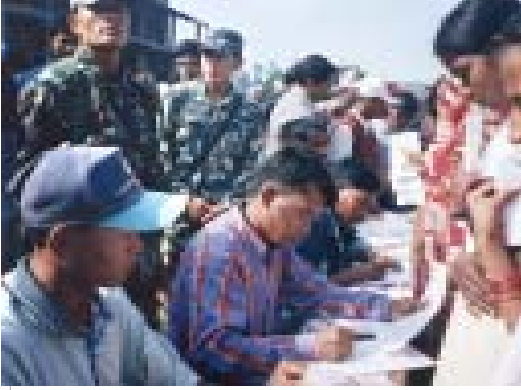
सन् २००५मा चितवनमा आयोजित नागरिकता वितरण शिविरमा आवेदन लेख्न मद्दत गर्दै चेपाङ कार्यकर्ताहरू