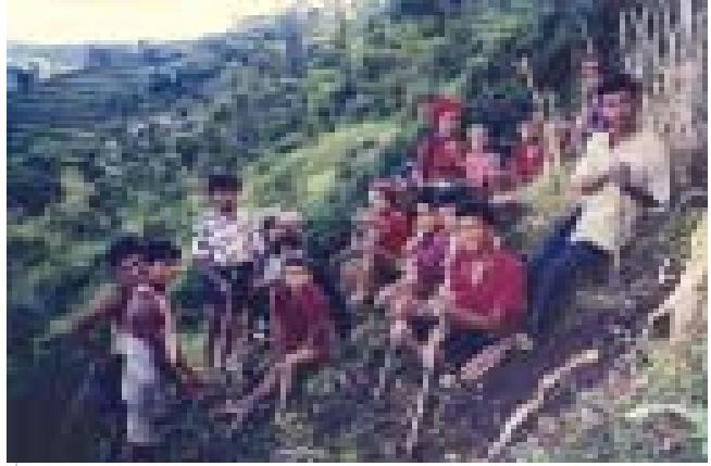
सन् १९९०को दशकमा चितवनको एउटा भीरमा खेती गर्दै

चेपाङ मध्य चितवन, धादिङ्ग, गोरखा, मकवानपुर, लमजुङ र तनहुँ जिल्लाहरूको उच्च पहाडी क्षेत्रमा बसोबास गर्ने एउटा आदिवासी जाति हो। आदिवासी जनजाति उत्थान राष्ट्रिय विकास प्रतिष्ठान (नेफडीन) ले उनीहरूलाई अति सीमान्तकृत आदिवासी भनेर वर्गीकृत गरेको छ। मुलुकी ऐन १९२० ले चेपाङलाई मसिन्या मतवाली भनेर परिभाषित गरेको कारण आर्थिक विपन्नताका अतिरिक्त चेपाङ जातिले साँस्कृतिक भेदभावको पनि सामना गर्दै आउनु पर्यो।