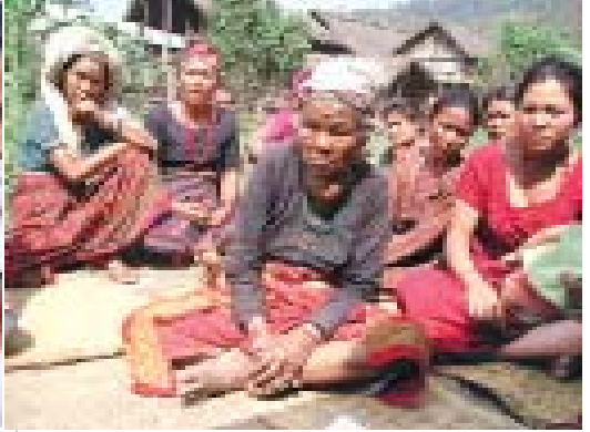
नागरिकताको प्रमाणपत्र प्राप्त गरेपश्चात बृद्ध भत्ता पाउन आफूले गर्नु परेको संघर्ष सुनाउँदै मकवानपुरकी एक चेपाङ महिला