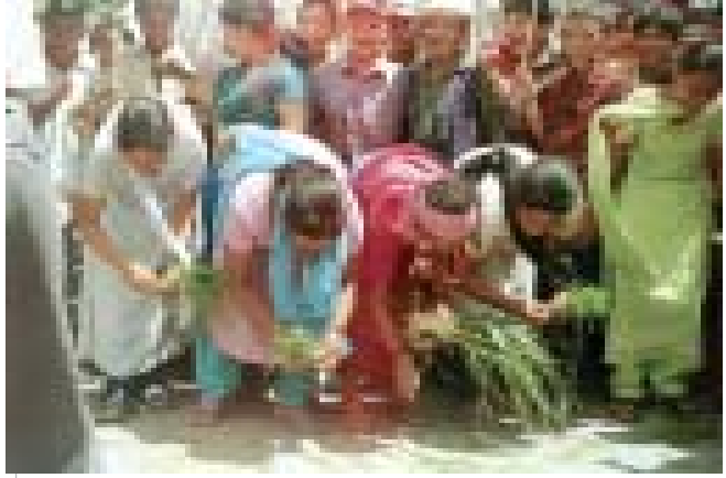
सन् २००६ मा गोरखामा भूमि अधिकारका सम्बन्धमा आयोजित एक अनुपम प्रदर्शन

निर्णय लियौं । तर आरबिएले उपलब्ध गराएको विश्लेषणात्मक ढाँचाले हामीलाई शसक्तीकरण प्रक्रियाको स्पष्ट बुझाइ प्रदान गर्‍यो ।” त्यस प्रकारका छलफलहरूको परिणाम स्वरूप पिसिडिपी १ को तैयारी ‘अधिकार बाहक’ र ‘जिम्मेवार निकाय’ जस्ता विकासे शब्दावलीहरूको प्रयोग बिना नै गरियो, तर न्यून चेपाङ र धेरै गैरचेपाङ रहेका सेवा प्रदायकहरू बीच शक्ति सम्बन्धलाई परिवर्तन गरिनुको महत्वमाथि प्रकाश पारिएको थियो । चेपाङहरू (अधिकार बाहक) को हकदावी गर्ने शक्ति बढाउने र गाविस वा गैससहरू (जिम्मेवार निकाय) आफ्नो जिम्मेवारी पूरा गर्ने क्षमतामा सुधार ल्याई सुहाउँदो वातावरणको विकास गर्ने उद्देश्यहरूलाई एकै ठाउँमा ल्याएर पिसिडिपी १ का लागि एउटा ढाँचा तयार गरियो ।